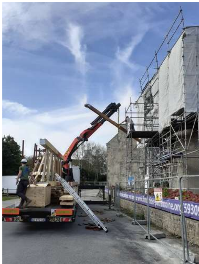
Grutage d'une des 4 poutres d'entrait