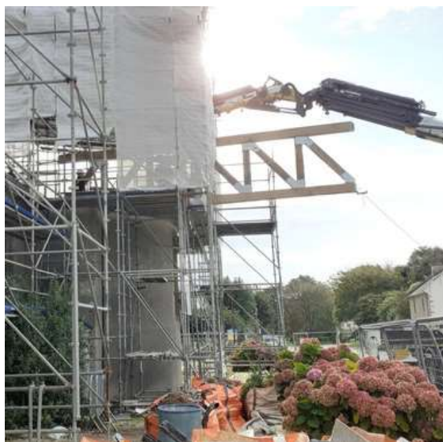
Grutage de la poutre maîtresse du transept

27 septembre : après un travail préparatoire le 26 septembre, les 3 charpentiers des Ateliers DLB guident le grutier dans le montage de la pièce maîtresse de la charpente : une poutre pesant pas moins de 900 kg, supportée par 2 fermes, qui assurera la planéité du faîtage du transept : impressionnant !