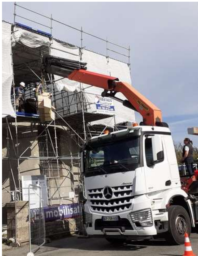
Grutage des éléments des fermes