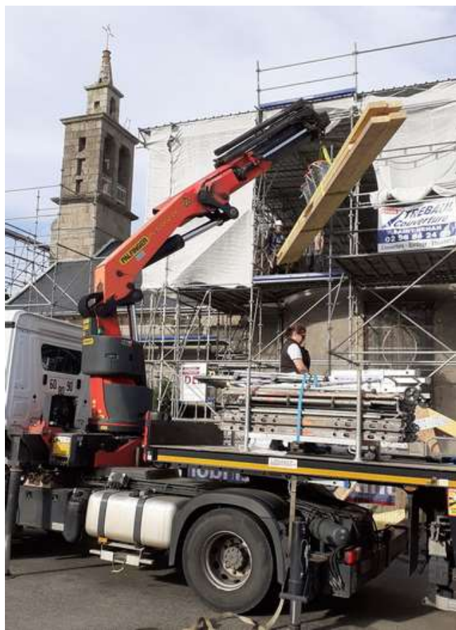
Grutage d'autres éléments de charpente