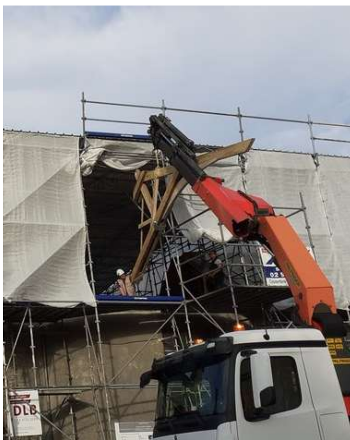
Grutage d'une des 3 demi-fermes