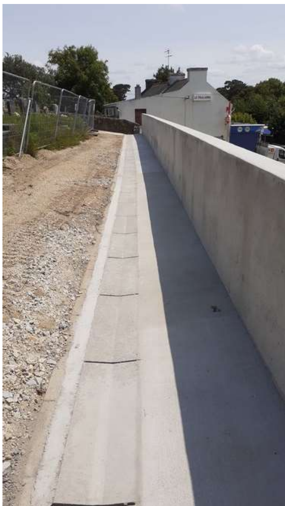
La cunette des eaux pluviales et les bordures en haut du mur

Le mur de soutènement est terminé : restent quelques travaux de maçonnerie.