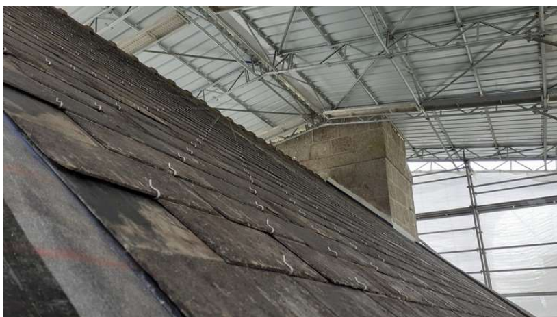
Côté Nord, avec les anciennes ardoises triées

26 mai : pose achevée des ardoises, tuiles faitières, gouttières et descente de gouttières de la nef par les couvreurs de Trébaul Couverture.