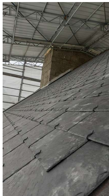
Côté Sud, les ardoises neuves

2 juin : arrivée des échafaudages du transept (ci-contre, stockés devant l'église)