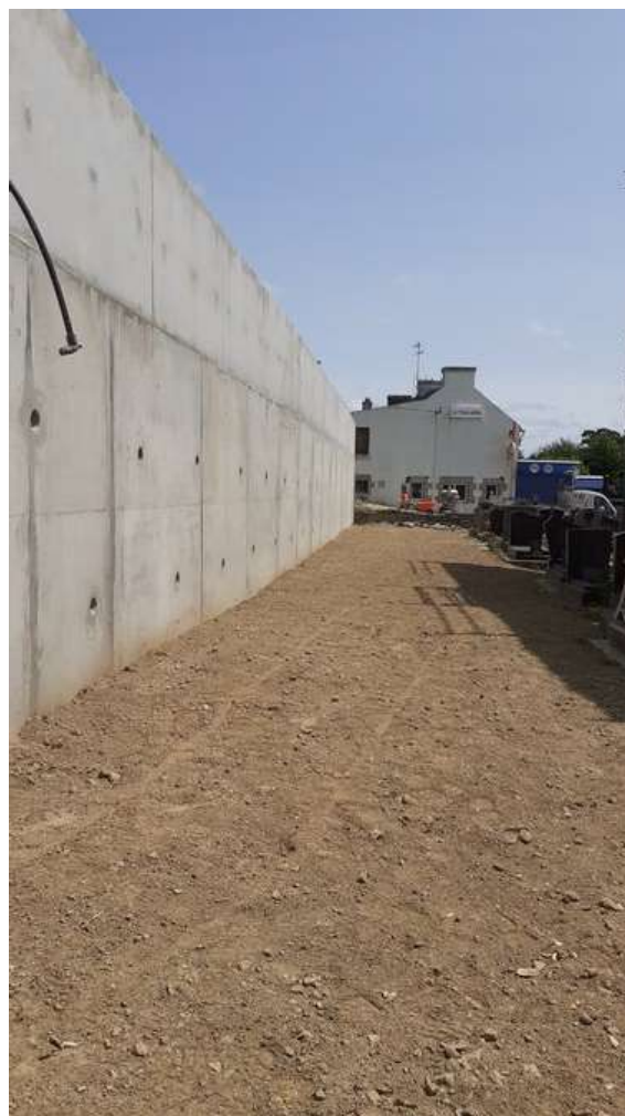
Vue du mur de la partie basse, avec le mélange terre-pierre sur la semelle béton