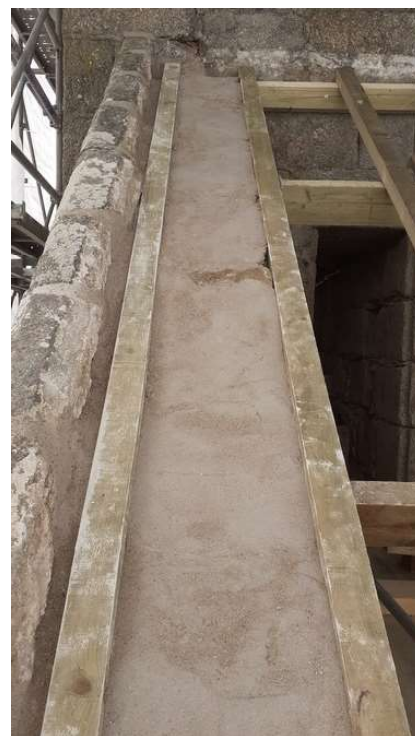
Détail de la restauration des pignons du clocher