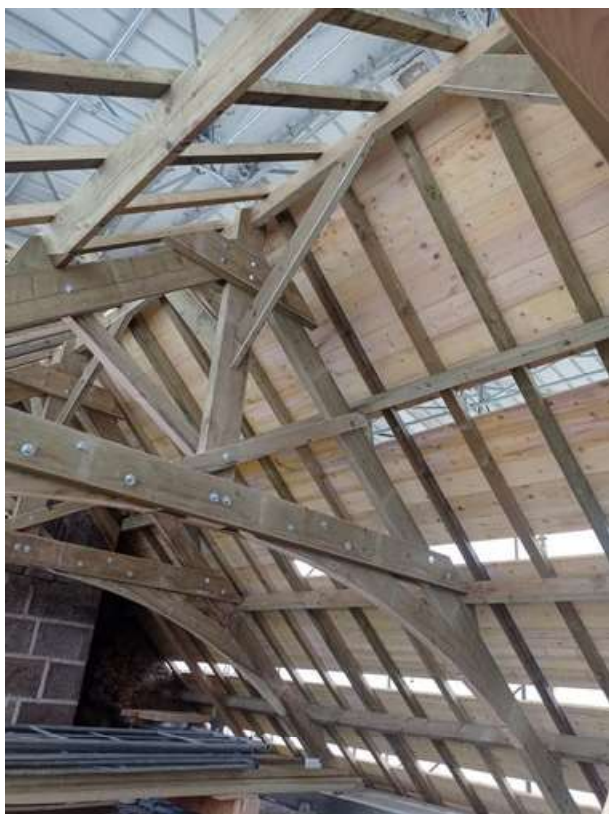
Pose de la volige côté Nord de l'église

4 mai : arrivée des couvreurs : début de pose de la volige (photos ci-dessous).