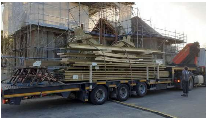
Le bois de charpente dans le camion à son arrivée au Bourg

20 avril : arrivée de la charpente au Bourg. Les fermes pré-assemblées aux Ateliers DLB et les chevrons ont été grutés directement sous le parapluie et sur l'échafaudage (photos ci-dessous).