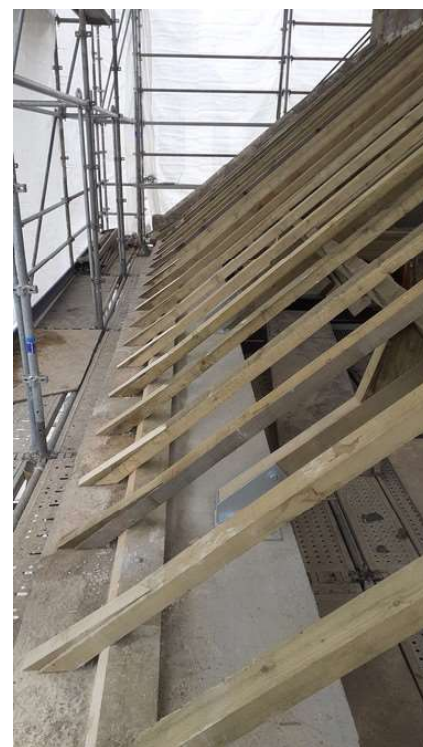
Détail des fermes de la charpente fixées à la poutre béton armé et des chevrons posés sur les pierres de corniches restaurées