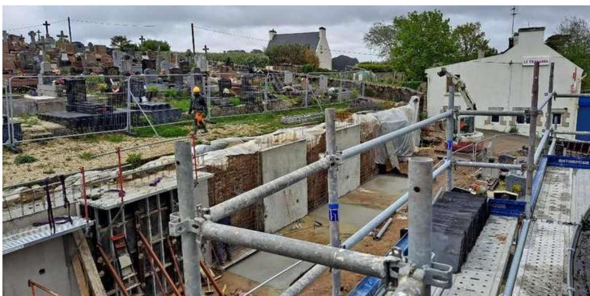
Photo Candio architecte : l'avancée du chantier mur vue de l'échafaudage de l'église

Le cimetière est désormais sauvé : tout risque d'effondrement du mur est écarté.