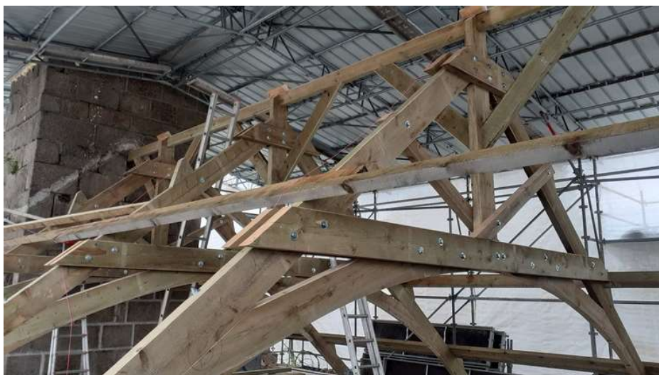
La charpente en cours de montage le 26 avril

La même semaine, les maçons de chez Lefèvre ont scellé les éléments de charpente et restauré les hauts de murs dans le pignon occidental de l'église (détail du mortier de chaux ci-dessous à droite).