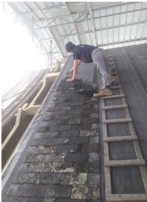
Début de pose des ardoises côté Nord. A noter la différence de niveau entre le faitage affaissé du transept à gauche et celui de la nouvelle charpente