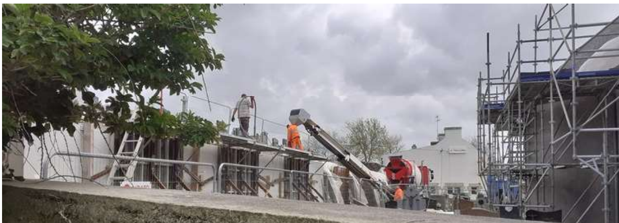
Le 24 avril, coulage du béton dans les banches ferrillées

Du côté du mur de soutènement : poursuite de l'empierrement du sol, ferrailage de la semelle et des contrevoiles, coulage du béton armé, début du ferrailage du parapet (photos ci-dessous).