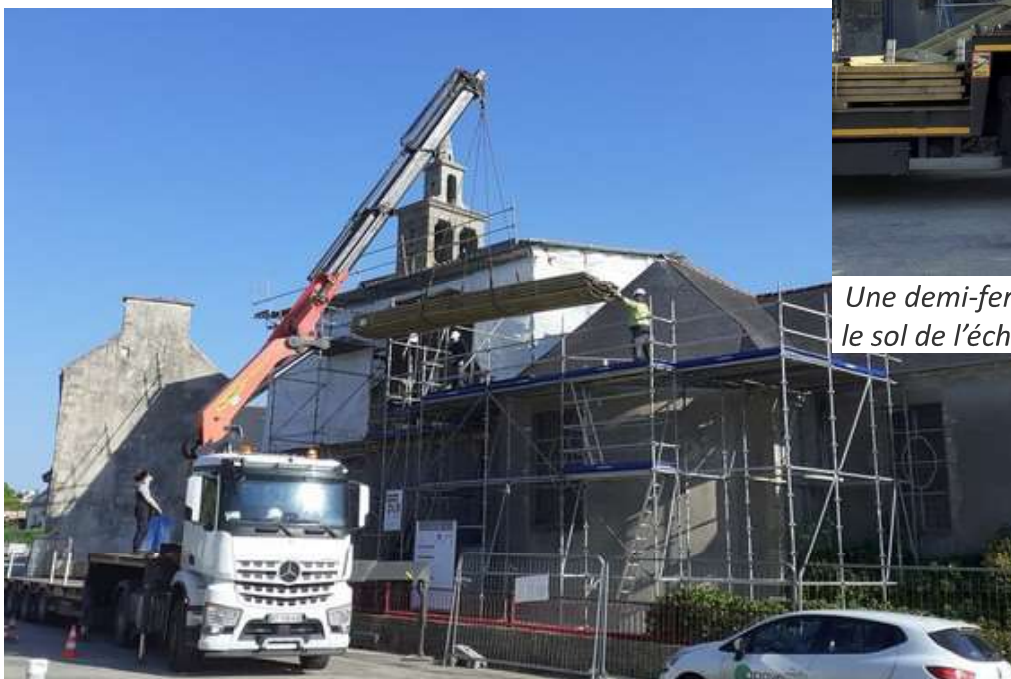
Le bois d'assemblage de la charpente gruté sur l'échafaudage