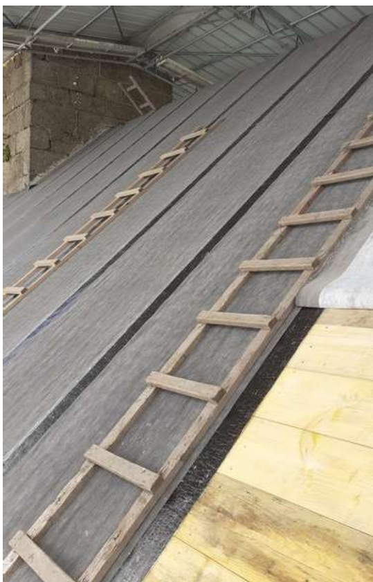
Vue de la volige et du feutre bitumé côté Sud du toit

11 mai : la volige et le feutre bitumé sont en place ; sur le côté Nord, début de pose des anciennes ardoises démontées et triées sur place ; un nettoyage ravivera les ardoises après la pose. Le versant Sud sera recouvert d'ardoises neuves.