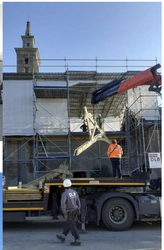
Une demi-ferme grutée directement sur le sol de l'échafaudage sous le parapluie