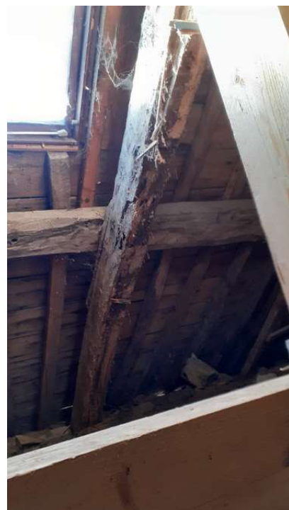
Détail de la charpente

Dans le même temps, dépose des lustres en vue de leur restauration