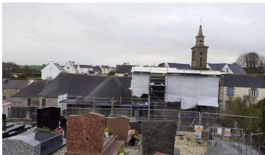
La couverture du parapluie et les bâches en cours d'installation côté Nord