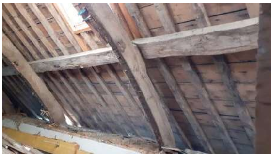
La charpente et l'arase de mur à nu