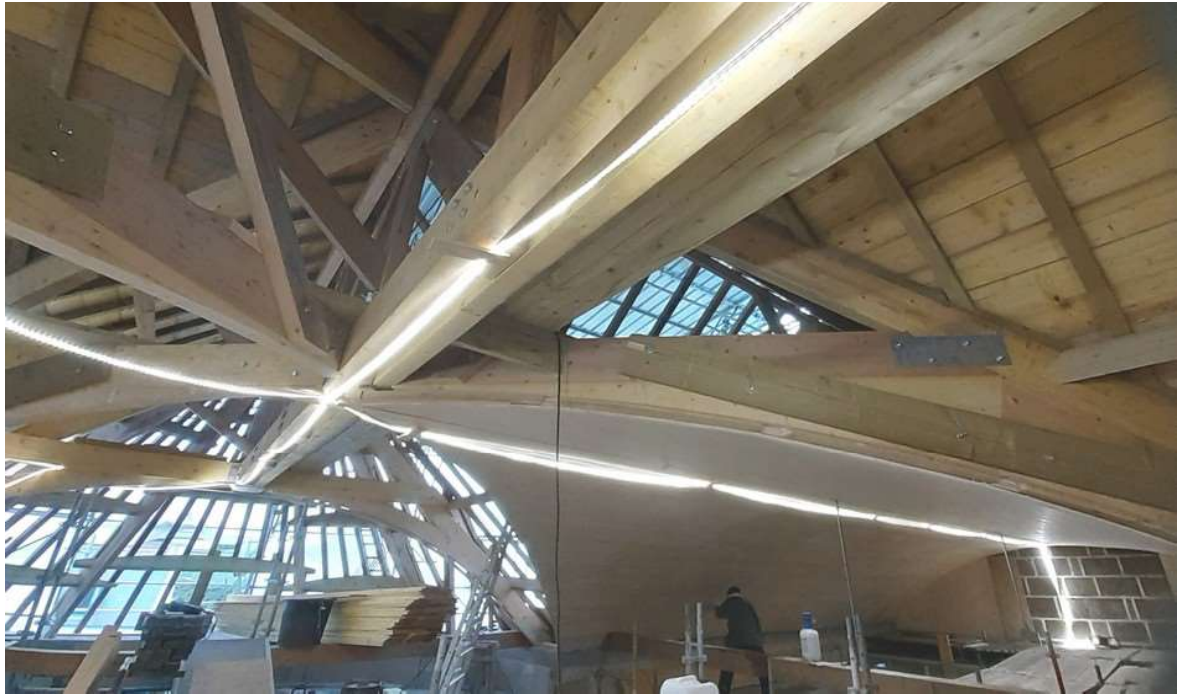
Une autre vue de la charpente du transept et la partie voûte posée.