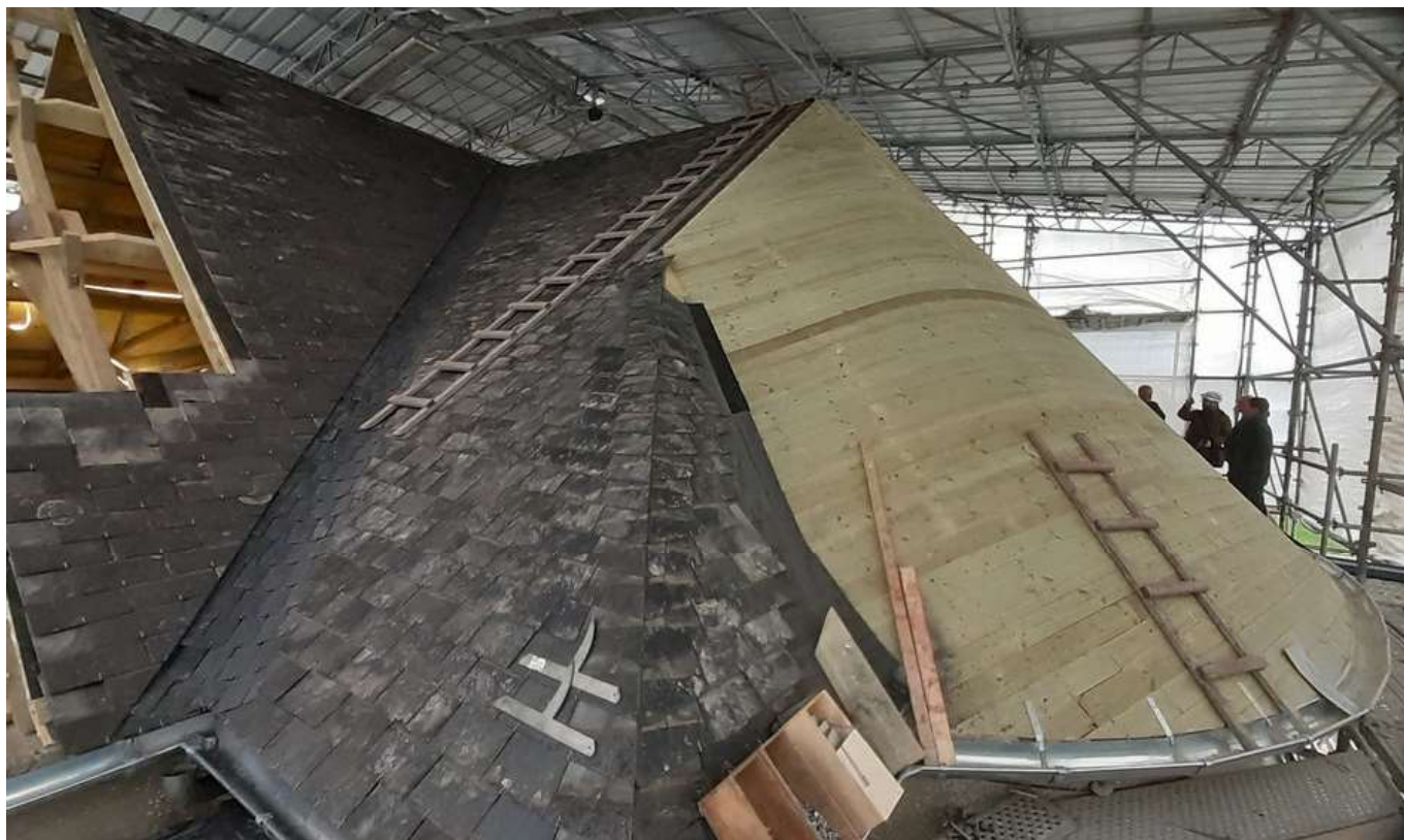
L'avancement de la pose des ardoises côté Nord Est.

Le 19 décembre, une livraison d'échafaudages a été faite par Entrepose Échafaudages, pour la partie chœur et sacristie.