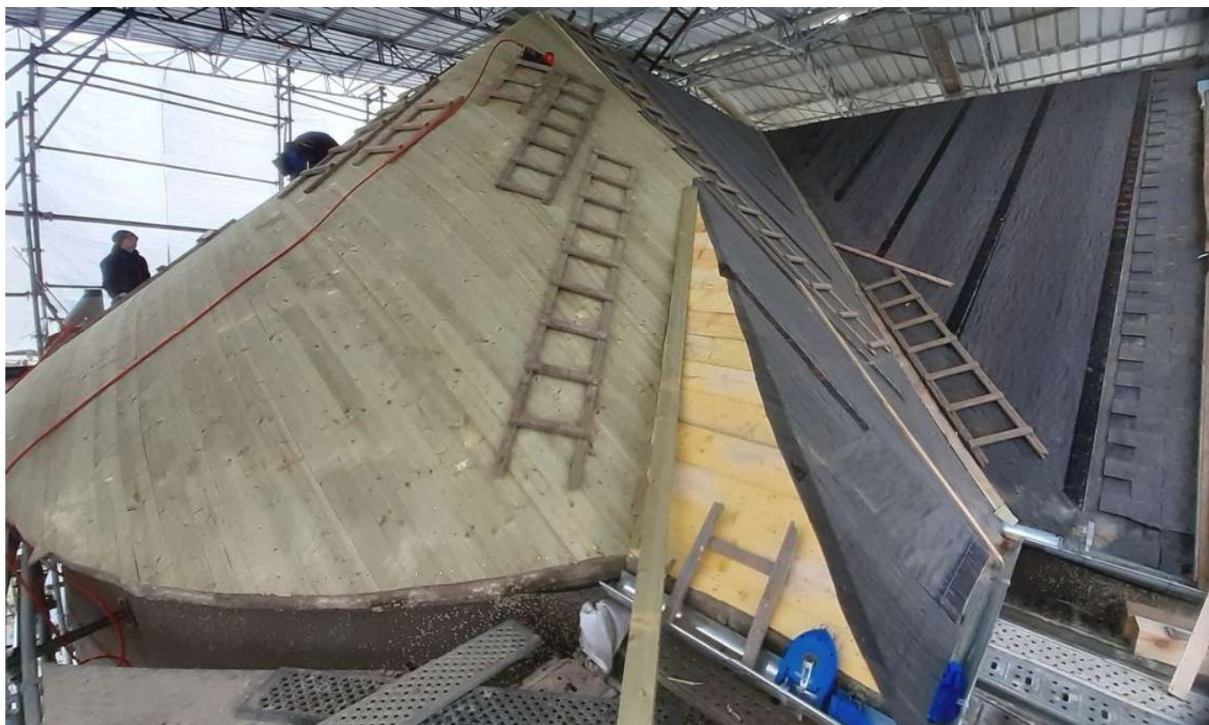
Vue de l'arrondi côté Nord Ouest

7 décembre : avancée spectaculaire de la pose de la volige et du feutre imperméabilisant côté Nord. Lors de la réunion de chantier, nous avons pu voir comment les couvreurs croisaient, coupaient et clouaient les 2 couches de volige pour obtenir des arrondis parfaits.