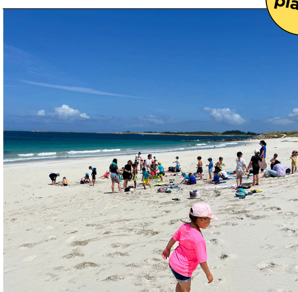
Saint-Pabu > Lanildut Mini camp itinérant 9-11 ans