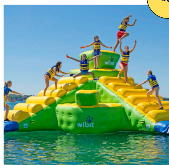
La Vendée à vélo Séjour 12-15 ans