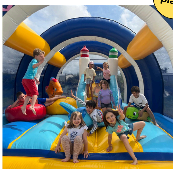
Camping de l'Aber Benoît Mini camp 6-8 ans