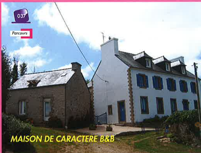
MAISON DE CARACTERE B&B

Cette maison a été la première mairie de notre commune ; ces murs ont également abrité l'école publique des garçons, puis l'école publique mixte jusqu'en 1970 environ. Elle fut rénovée courant 1983 (informations cadastrales). Ce jour, lieu d'accueil et de gîte B & B.