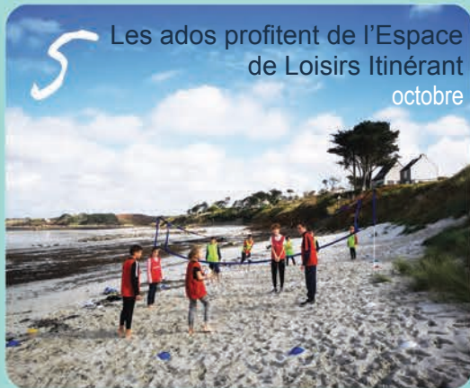
5 Les ados profitent de l'Espace de Loisirs Itinérant octobre