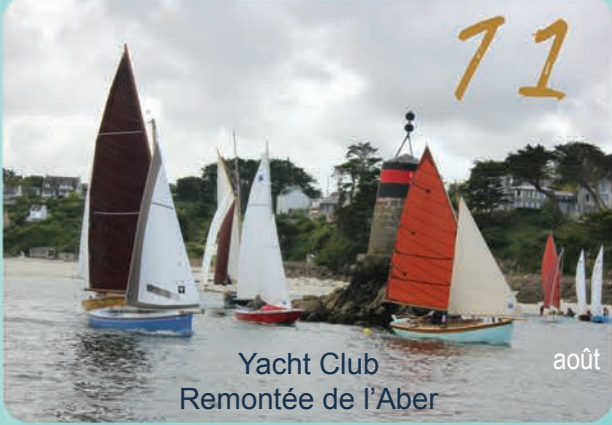
Yacht Club Remontée de l'Aber août