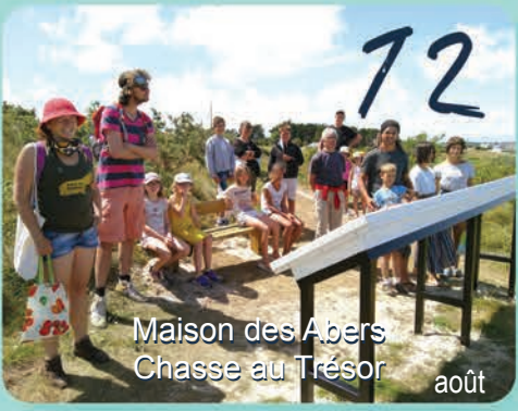
72 Maison des Abers Chasse au Trésor août