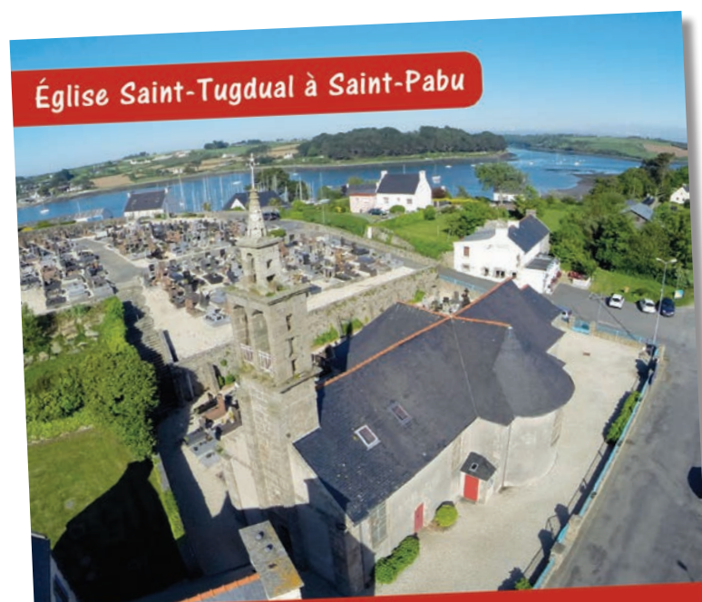
Église Saint-Tugdual à Saint-Pabu

Une vidéo proposant une visite virtuelle de l'édifice est en projet.