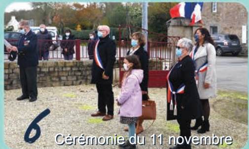
6 Cérémonie du 11 novembre