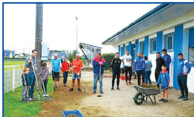
une partie des bénévoles met la main à la pâte pour des travaux extérieurs

Plourin. Les adultes peuvent quant à eux évoluer au sein de 2 équipes séniors ou d'une équipe loisir. Cette poussée des jeunes est très révélatrice du pouvoir attractif du football à Saint-Pabu. Pourtant, l'association, ayant également croisé le chemin de la Covid, rencontre une certaine difficulté économique. La crise sanitaire a eu raison du traditionnel moules-frites du 15 août, ce qui d'ordinaire constitue une des principales ressources financières du club. Mais le président ne désespère pas et regarde en avant "Pour l'année prochaine, nous espérons organiser le Challenge Yves Cadour au mois de juin et notre traditionnel moules frites du 15 août si la Covid nous laisse un peu tranquilles". Si le dernier confinement n'avait pas arrangé les conditions d'exercice des associations, les sportifs sont, eux, bel et bien là et il en faudrait plus pour les décourager.