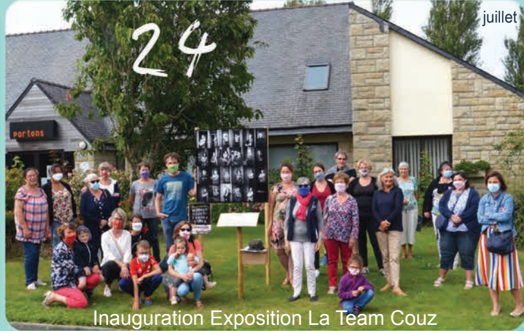
24 juillet Inauguration Exposition La Team Couz