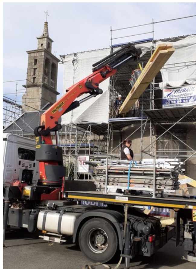
Grutage d'autres éléments de charpente