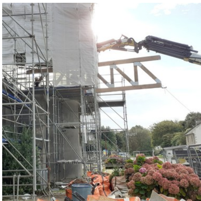
Grutage de la poutre maîtresse du transept

27 septembre : après un travail préparatoire le 26 septembre, les 3 charpentiers des Ateliers DLB guident le grutier dans le montage de la pièce maîtresse de la charpente : une poutre pesant pas moins de 900 kg, supportée par 2 fermes, qui assurera la planéité du faîtage du transept : impressionnant !