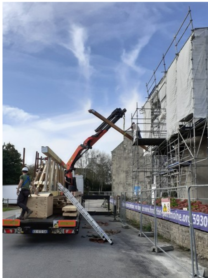
Grutage d'une des 4 poutres d'entrait