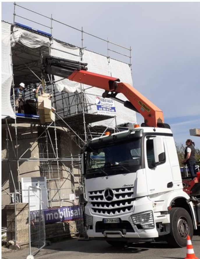
Grutage des éléments des fermes