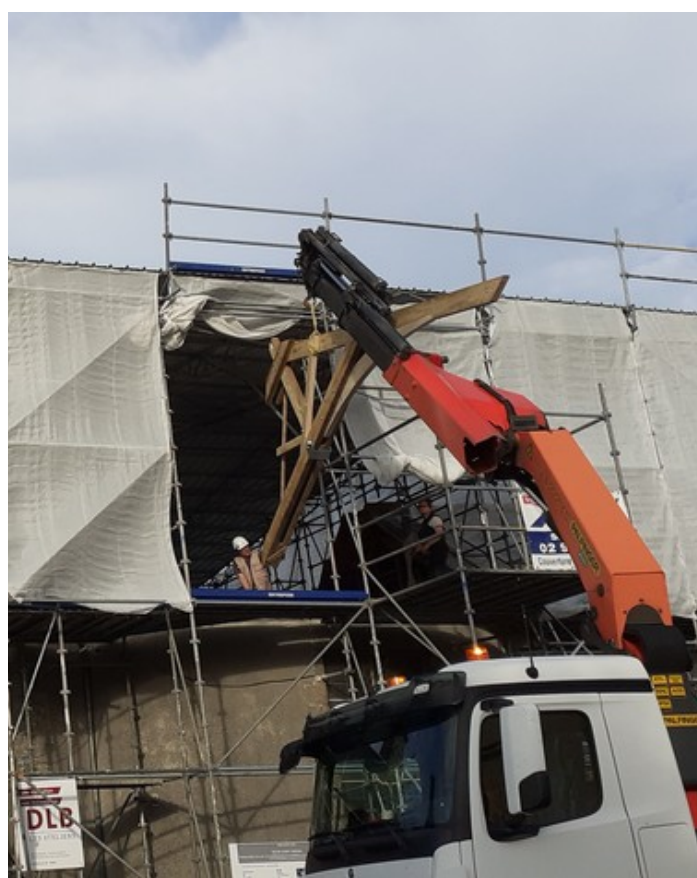
Grutage d'une des 3 demi-fermes