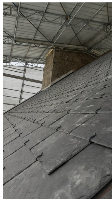
Côté Sud, les ardoises neuves

2 juin : arrivée des échafaudages du transept (ci-contre, stockés devant l'église)