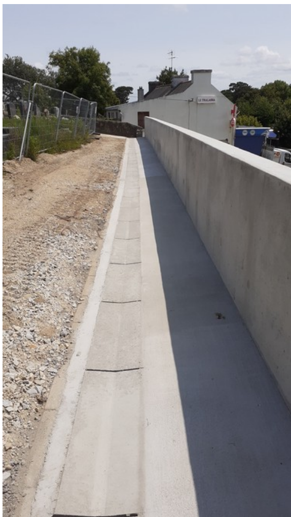
La cunette des eaux pluviales et les bordures en haut du mur

Le mur de soutènement est terminé : restent quelques travaux de maçonnerie.