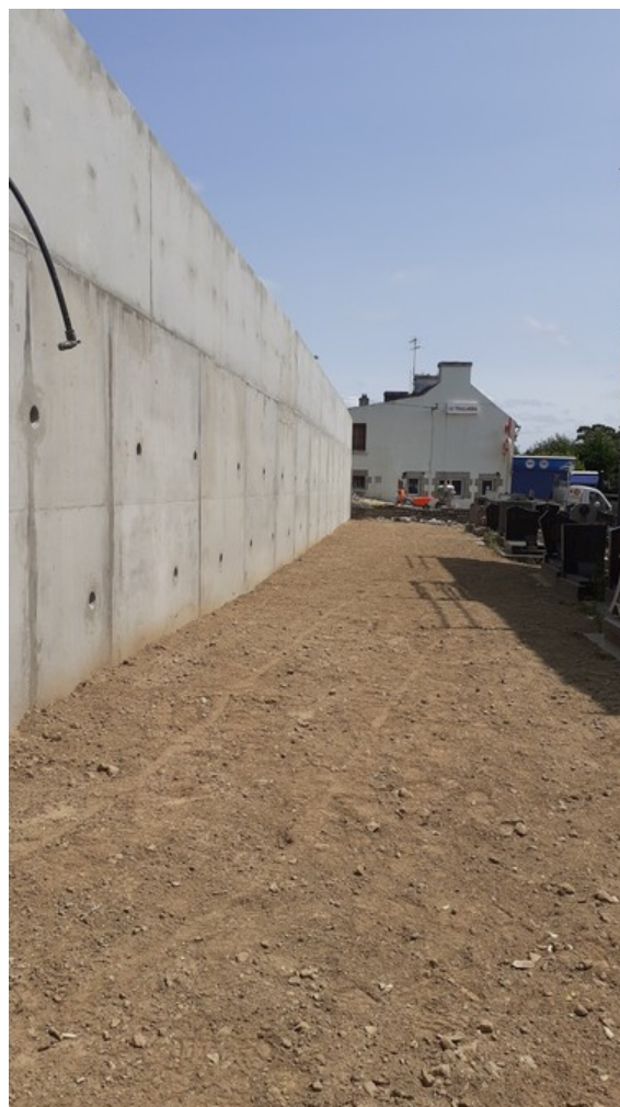
Vue du mur de la partie basse, avec le mélange terre-pierre sur la semelle béton