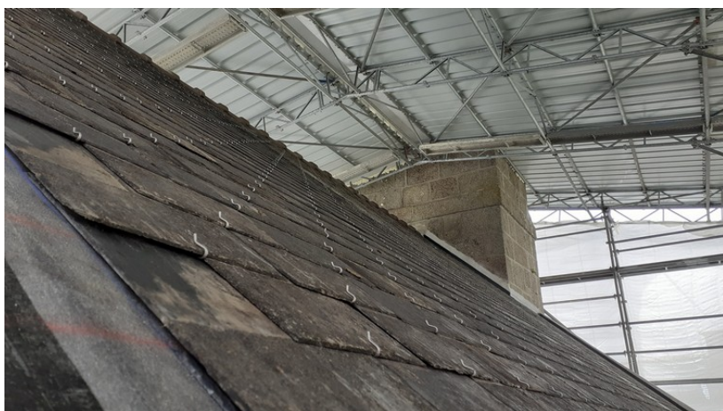
Côté Nord, avec les anciennes ardoises triées

26 mai : pose achevée des ardoises, tuiles faitières, gouttières et descente de gouttières de la nef par les couvreurs de Trébault Couverture.